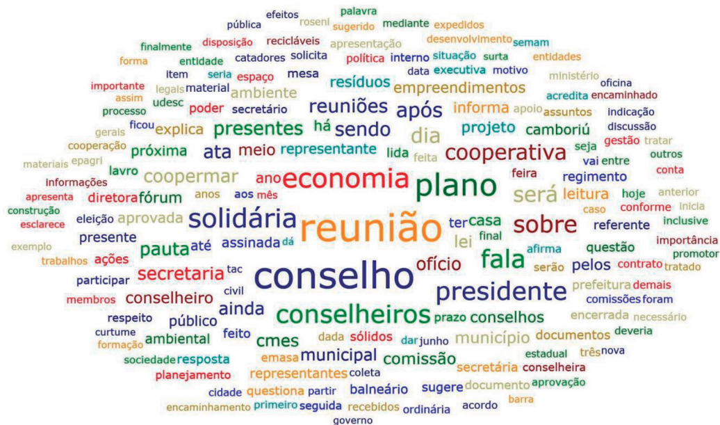
FIGURA 2 Nuvem de palavras das atas do CMES (2018 e 2019)

Elaboração dos autores a partir das atas do CMES (2018 e 2019). 25