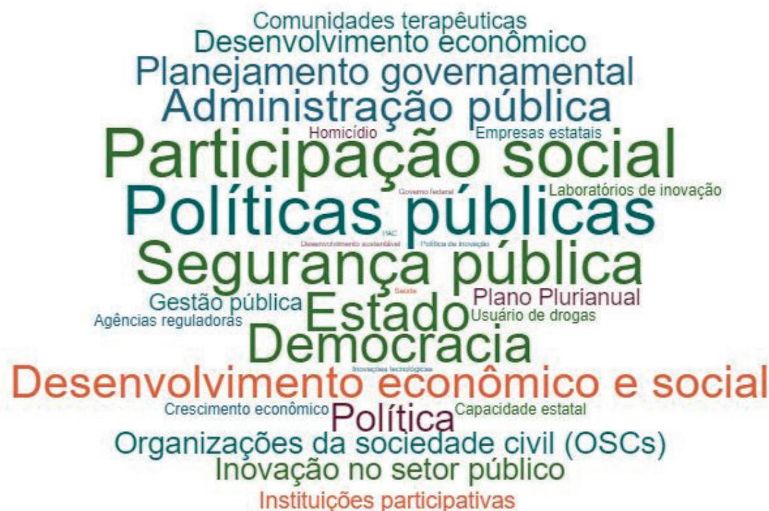
FIGURA 1 Diest: nuvem de palavras-chave das publicações

A chave-analítica políticas públicas parece ser o objeto de análise comum de grande parte dos trabalhos, como esperado, dada a missão institucional do Ipea. Além dos termos gerais que denotam a atuação estatal, tais como Estado e administração pública, termos que caracterizam temáticas mais específicas como participação social; segurança pública; democracia; desenvolvimento econômico e social; planejamento governamental; entre outros, também se demonstraram proeminentes.