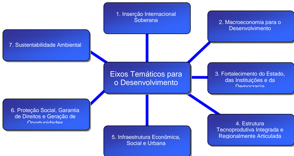
Figura 2. Eixos Temáticos para o Desenvolvimento