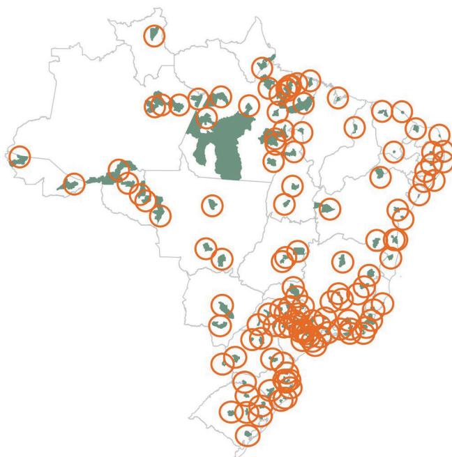
FIGURA 2 Cidades-sede e cobertura em um raio de 100 km da Proposta I