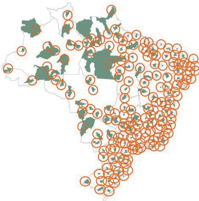
FIGURA 5 Cidades-sede e cobertura em um raio de 100 km da Proposta IV