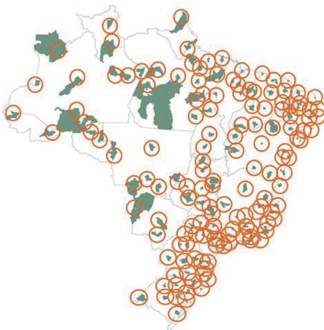
FIGURA 3 Cidades-sede e cobertura em um raio de 100 km da Proposta II

Uma análise dos concursos realizados anteriormente fundamenta este procedimento. Como vimos previamente nesta nota, Inbra e Funai, nos concursos de 2010 e 2016, tiveram suas provas realizadas em municípios que fugiam ao perfil majoritário dos concursos. Com isso, a Proposta II chegou a uma lista de 149 cidades, conforme ilustra a figura 3.