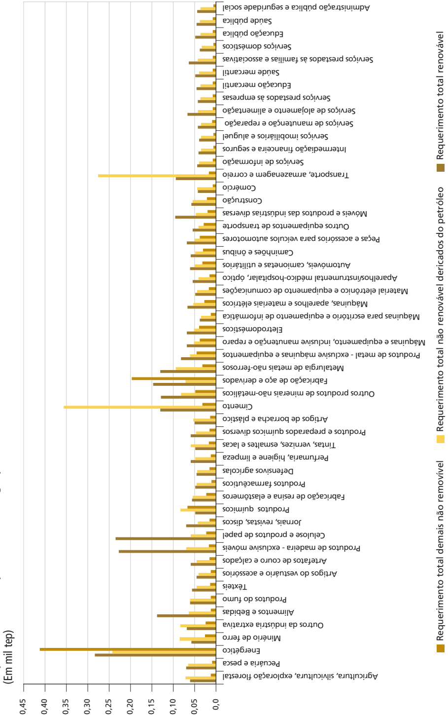
GRÁFICO 2 Requerimento totais por fonte de energia para cada setor da economia brasileira (2009) (Em mil tep)