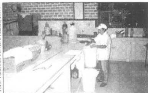
Laboratório de Manipulação de ervas medicinais da Farmácia Viva do Movimento Integrado de Saúde Mental, Fortaleza/CE.

ecaminhar estes moradores ao atendimento do Hospital das Clínicas da Universidade Federal do Ceará (UFC). Em seguida, por decisão do professor responsável pelas práticas de psiquiatria, que entendeu que o tratamento dos novos pacientes poderia ser mais eficaz se fosse realizado dentro do seu próprio contexto social e familiar, passou a atendê-los na própria comunidade de Pirambú.